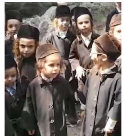
א חתן נאך פאר די בר מצוה...

זיי האבן אונז געהאלטן אין א קעלער אינעם עירפארט, וואו דער מצב איז געווען זייער שווער. זיי האבן אונז באמת געוואלט צוריקשיקן קיין גואטאמאלא, אבער מיר האבן זיך