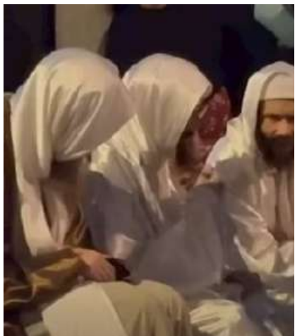
מען האט געדארפט זיין זיבן אזייגער צופרי פאר א שעה התבוננות

טאמער איינער האט זיך צו דעם נישט צוגעשטעלט איז געקומען תיקונים! (מיר וועלן באלד אריינגיין מער אין