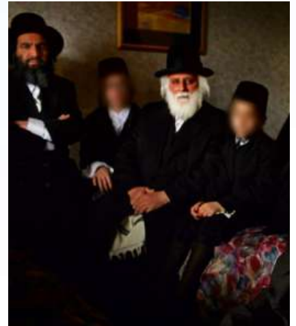
מזל טוב צום שידוך!