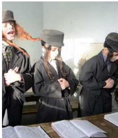
ווי פארשטענדליך בין איך געגאנגען אינעם ארטיגן חדר

נישט גורס דארט, און אפילו ביי די יונגעלייט עקזיסטירט כמעט נישט די מושג פון לערנען גמרא. ווי די הנהלה (הערת הכותב: די 'הנהלה' באדייט די עטליכע ראשים דארטן וואס זיי מאכן אלע החלטות, זיי מוז מען פאלגן, זיי טיילן מלקות און עונשים וכו' וכו') פלעגט זאגן, אז גמרא איז בכלל נישט וויכטיג, דער עיקר איז צו קענען די ספרים פונעם רבי'ן (דער מייסד שלמה העלבראנץ), און אין דעם האט מען טאקע כסדר