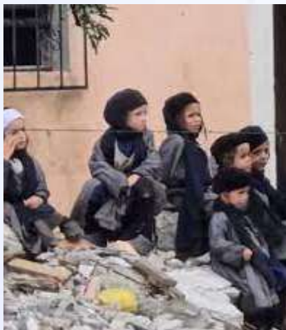
מיר האבן געלעבט אין שטענדיגע פחד

מען האט צעטיילט דאס גאנצע פלאץ צו קליינע שטיבעלעך, אפגעטיילט מיט א דינע פלעסטיק אינצווישן, און יעדער האט באקומען איין 'הויז'. מען האט ווי פארשטענדליך פון געהערט יעדער פונעם צווייטן און אין מערסטנס פעלער האט מען אויך געקענט אריינקוקן, וויבאלד די פלעסטיק איז געווען פיל מיט לעכער, און עס איז געווען א נארמאלע ערשיינונג אריינצוקוקן צום שכן. די בודקעלע/