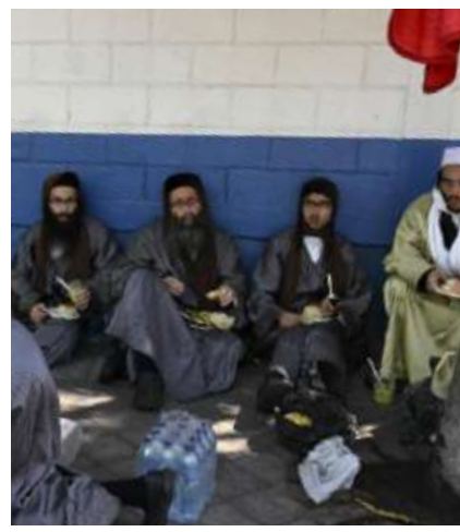
טון עפעס קען די הנהלה איז געווען דאס ערגסטע...

אה, די ערשטע זאך האבן אונז נישט געטארט אהיימגיין פאר די קומענדיגע האלבע יאר! דאס מיינט נישט איבערטועטן די שוועל פונעם