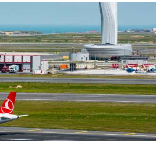
דער טערקישער לופטפעלד וואו מיר האבן באזוכט דריי מאל אין אפאר טעג...

צום ערשט זענען מיר געפארן קיין איראק, די איראקער האבן אונז אבער נישט געוואלט לאזן בלייבן דארט און אונז ארויסגעווארפן