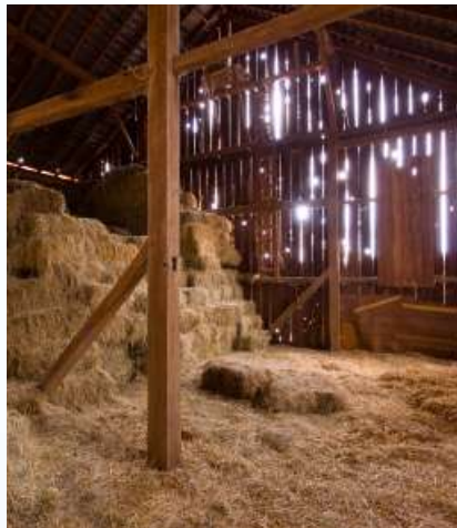
א שטאל איז ריין קעגן דעם ווייבער שול וואו אונז האבן געדארפט שלאפן

למעשה האמיר זיך געטראפן דריי חברים, וואס מיר האבן צוזאמען באשלאסן אז מיר גייען זיך אריבערכאפן קיין כנישתא חדא פאר א באזוך. מיר זענען געגאנגען איינמאל, און דאס האט נאכגעפאלגט מיט מערערע באזוכן, אזוי ווייט אז עס איז געווען א