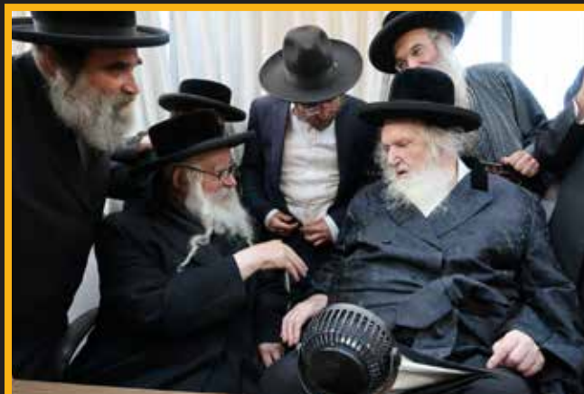
בסוד שיח עם כ"ק אדמו"ר ממשכנות הרועים שליט"א