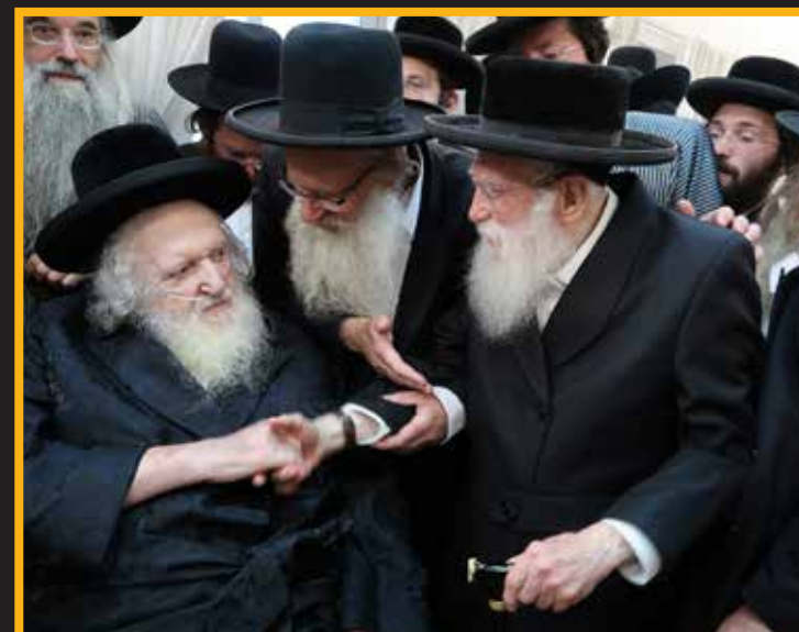
הגאון הגדול רבי חיים אורי פריינד חבר הבד"ץ מתברך