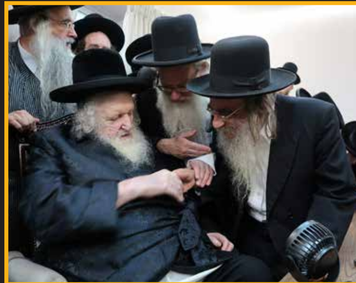
הגאון הגדול רבי נתן קופשיץ דומ"ץ עדתנו ומרא דאתרא דקרי"ה בי"ש מתברך