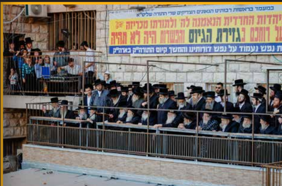
כ"ק אדמו"ר מתולדות אהרן שליט"א בקבלת עול מלכות שמים