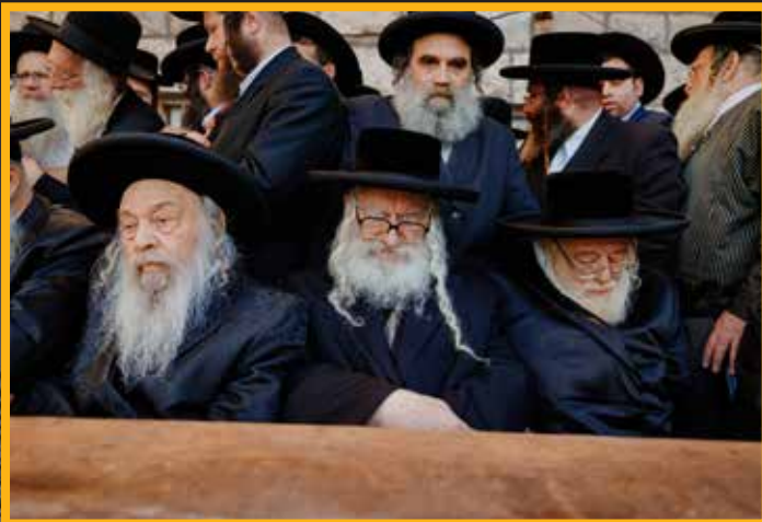
כ"ק אדמו"ר מתולדות אהרן, כ"ק אדמו"ר ממשכנות הרועים, הגר"י ראזנבערגער, שליט"א