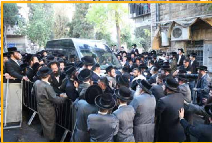
מרן הגאב"ד שליט"א בתחילת התהלוכה

זה שנים רבות לא זכינו למעמד כה נשגב וכה מאחד, אשר החזיר עטרה ליושנה, ובאה גזירת הגיוס בימינו והחזירה אותנו למקורותינו, שאי סביב עינייך וראי כולם נקבצו ובאו לך, תחת צילם של רבותינו, ובאה עצרת כבירה זו והזכירה לנו זאת ובכוח זה נמשיך בעוז ובעוצמה להתגבר על הגזירות ויכול נוכל להם בס"ד.