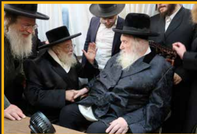
בסוד שיח עם כ"ק אדמו"ר מתו"א שליט"א