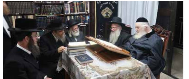
עם ראשי הנהלת עדתנו אודות העצרת