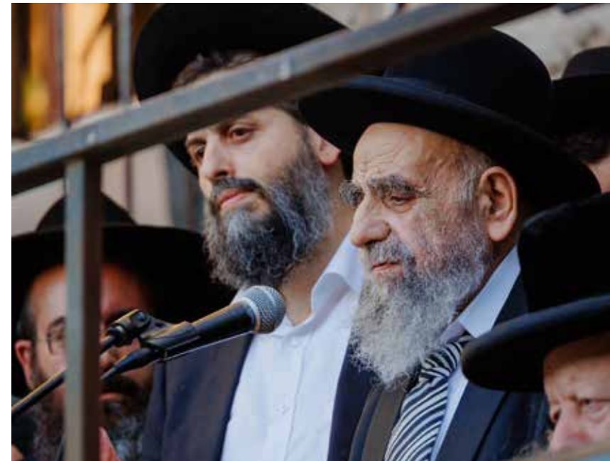
הגאון רבי משה צדקה שליט"א נושא דברים בעצרת

מורי ורבותי הרבנים הגאונים, קהל קדוש. רבותינו אמרו כינוס לצדיקים הנאה להם והנאה לעולם. הכינוס הזה, עוד לפני התוצאות שלו, עצם הכינוס הוא הנאה להם והנאה לעולם, כל העולם כולו יכול להתעורר תשובה מעצם הכי נוס הזה, כי כשמתגבר רוח הקדושה, הקדושה מתפשטת לכל העולם, שנזכה כולנו לחזור בת שובה שלימה.