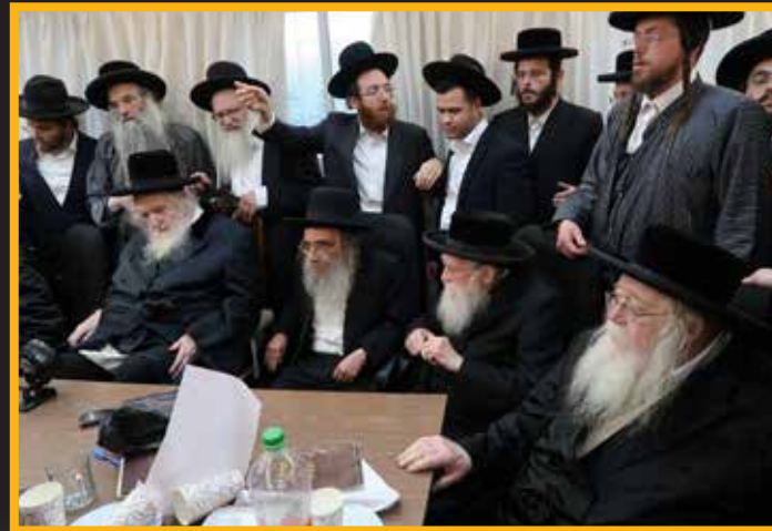
הגאון הגדול רבי יעקב מגדל יאראוויטש חבר הבד"ץ, הגאון הגדול רבי חיים אורי פריינד חבר הבד"ץ, הגאון הגדול רבי נתן קופשיץ דומ"צ ומרא דאתרא דקרי"ה בי"ש