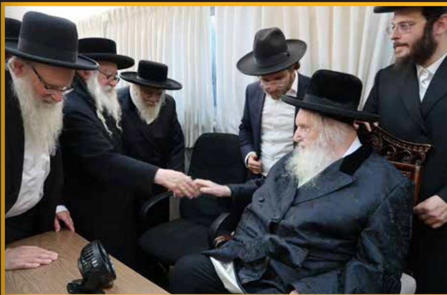
כ"ק האדמו"רים מתו"א וממשכנות הרועים עם כ"ק מרן הגאב"ד שליט"א

בו כל בחורי ישראל אשר יקדישו את מחצית השעה הראשונה בסדר הלימוד ברציפות וללא הפסקת דיבור יוכלו להיכנס להגרלה מיוחדת על פרסים בס"ד פרטים נוספים יבואו