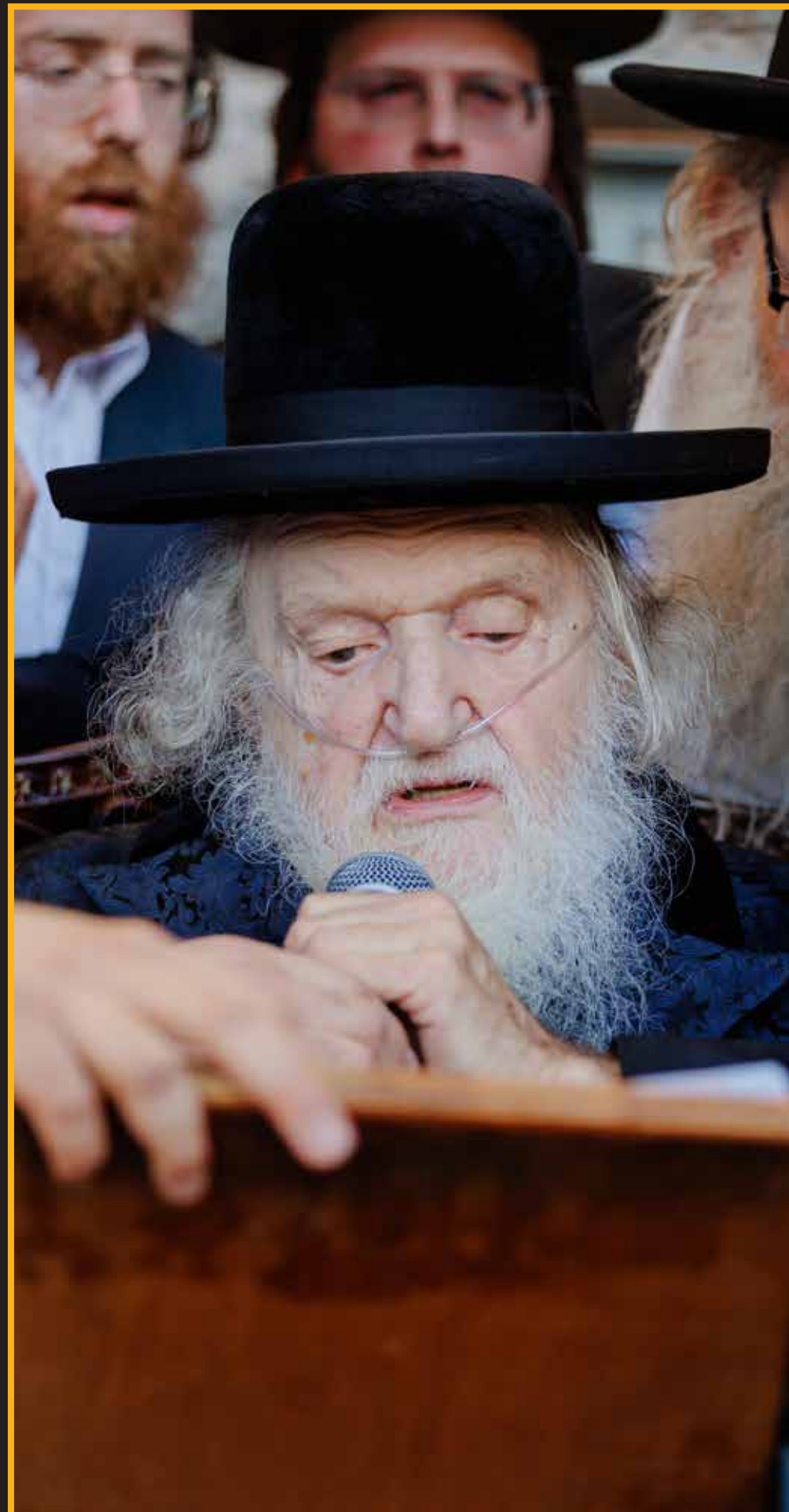
כ"ק מרן הגאב"ד שליט"א בדבריו חוצבי להבות אש קודש