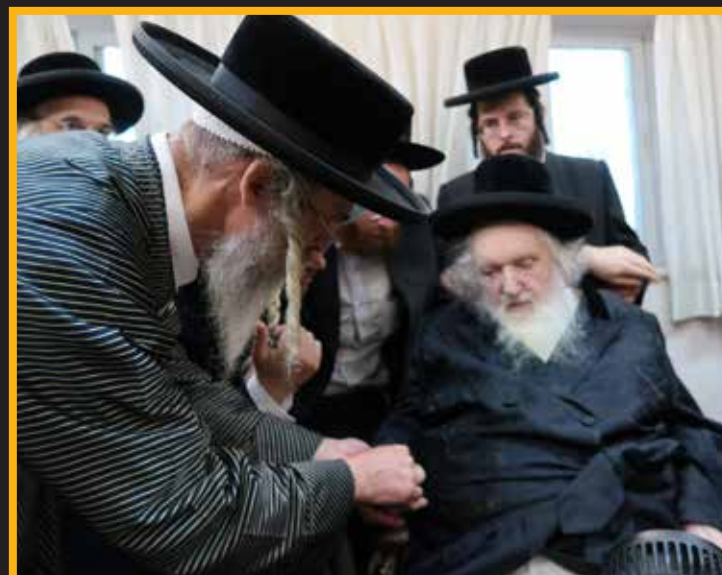
הגאון הגדול רבי אהרן ברנדסדורפר חבר הבד"ץ מתברך