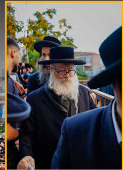
כ"ק אדמו"ר ממשכנות הרועים שליט"א מגיע אל העצרת