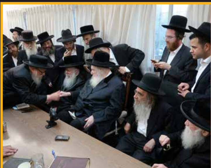
הגאון רבי משה טייטלבוים מו"ץ ומרבני ק"ק סאטמאר מתברך אצל כ"ק מרן הגאב"ד שליט"א