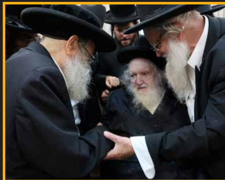
המקובל הגה"צ רבי גמליאל רבינוביץ מתברך