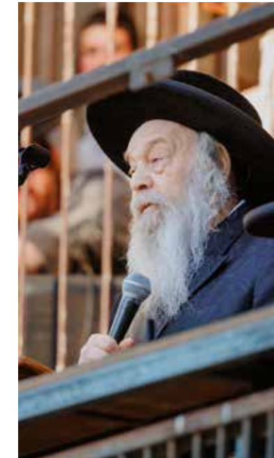
הגאון הגדול רבי יהושע ראזנבערגער שליט"א חבר הביד"צ נושא דברים בעצרת

נפשינו דבקה לארץ בטננו, כשבינינו עיר מדים כבר בשפל המדרגה, כשהאפשר כבר ללכת יותר, אז אומר לנו הפסוק, 'קומה עזר' תה לנו ופדינו למען חסדך, וכן אמר הפסוק, 'נפלה לא תוסיף', שאם אי אפשר כבר ליפול יותר, אז 'קום בתולת ישראל'. עכשיו אנו כבר בשפל המדרגה, אי אפשר כבר ליפול יותר, 'דבקה לארץ בטננו', הולכים לגזור בחורים מכלל ישראל, זה כבר שפל המדרגה ממש, וזה הזמן לבקש מהקדוש ברוך הוא, קומה עזרתה לנו, השי"ת ירחם עלינו שכל המדינה תתבטל במהרה.