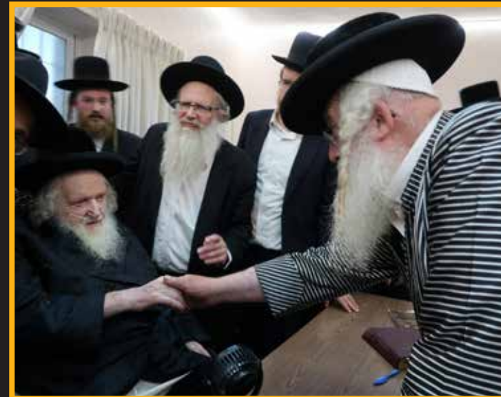
הגאון הגדול רבי שמואל ברנדסדורפר חבר הבד"ץ מתברך