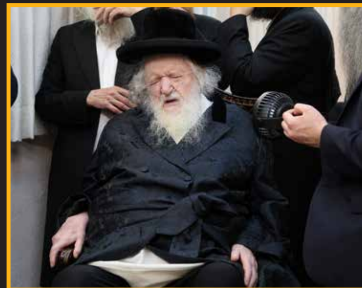
כ"ק מרן הגאב"ד שליט"א בתפילת מעריב אחרי המעמד בלשכת הבד"ץ