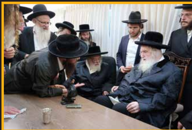
העסקן הר"ש שישיא בהתייעצות עם כ"ק מרן הגאב"ד שליט"א בדברים העומדים על הפרק