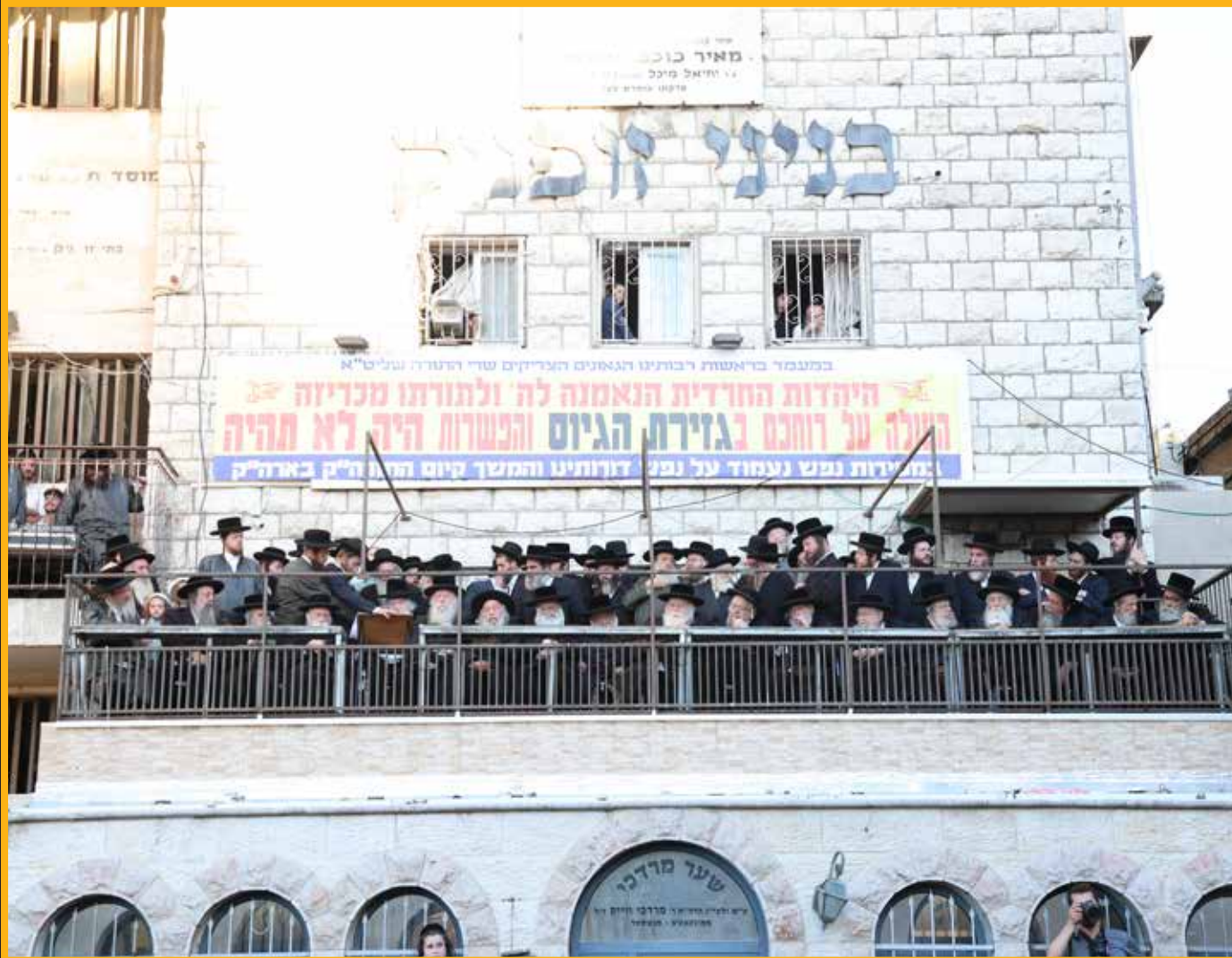
חברי הבר"ץ בראשות כ"ק רבינו הגדול מרן הגאב"ד שליט"א מרא דארעא קדישא על פני הגזוטה בכיכר זופניק

לכך התאספנו יחדיו לצעוק ולהריע כי אנחנו מוכנים ללחום במסירות נפש, עד שיוכל הקב"ה להעיד עלינו השבעתי אתכם בדורות של שמד, שזכינו לעמוד בנסיון הזה עד ביאת גואל צדק במהרה בימינו אמן.