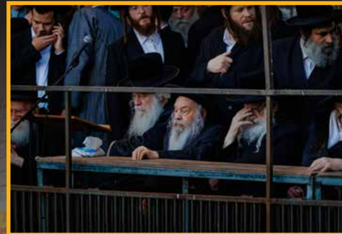
חברי הבר"ץ במעמד העצרת