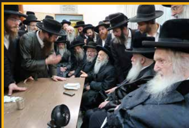
העסקן ר' שמעון פורס בפני רבותינו הגאון"צ שרי התורה שליט"א פרטים בלתי ידועים מחוקי הגיוס הנוראים