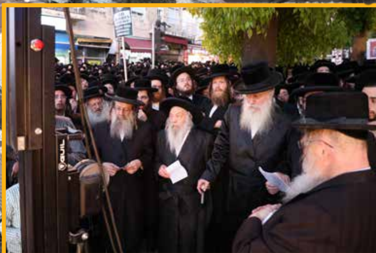
רבי הביד"צ בתהלוכה