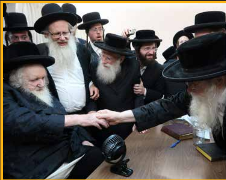
הגאון הגדול רבי יעקב מגדל יאראוויטש חבר הבד"ץ מתברך