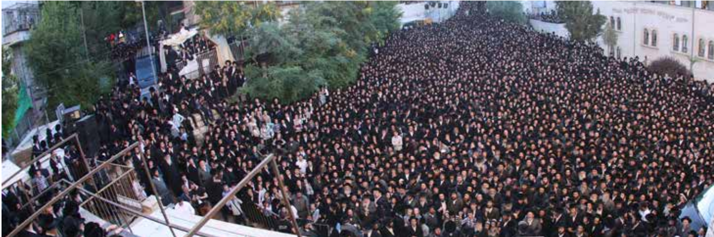
חלק מקהל הרבבות