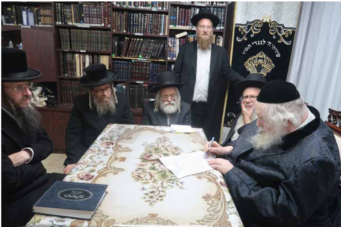
חותם על קריאת הקודש

שהוא רואה לנכון לעשות זאת. כל זה נמשך עד לשנות ה'ס' שאז הוגשה עתירה לבג"צ הציוני על ידי שונאי דת ידועים, בטענה שאין יכול להיות שאת האחד הוא לוקח לצבא השמד ואת השני הוא דוחה את גיוסו? כל עוד היה זה עם כמה מאות בחורים ניחא, אבל לדחות לעשרות אלפי בחורי ישיבות? ואכן כמצופה, הבג"צ הציוני פסל את ההסדר. ודרש מהממשלה לעשות הסדר חדש.