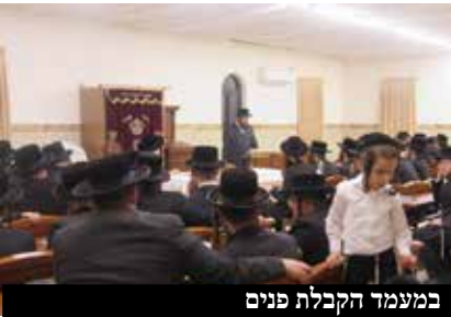
במעמד הקבלת פנים