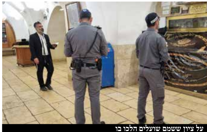
על ציין ששמו שועלים הלכו בו