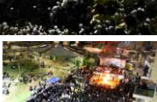
מעמד ההדלקה בהר יונה