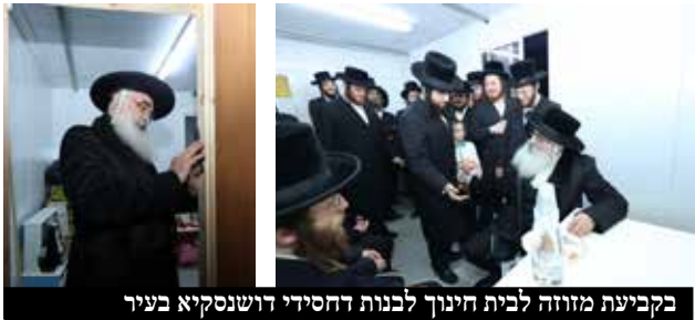
בקביעת מוזהר לבית חינוך לבנות דחסידי דושנסקיא בעיר