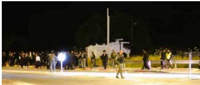
המשטרה מונעת באלימות הגעת ההמונים