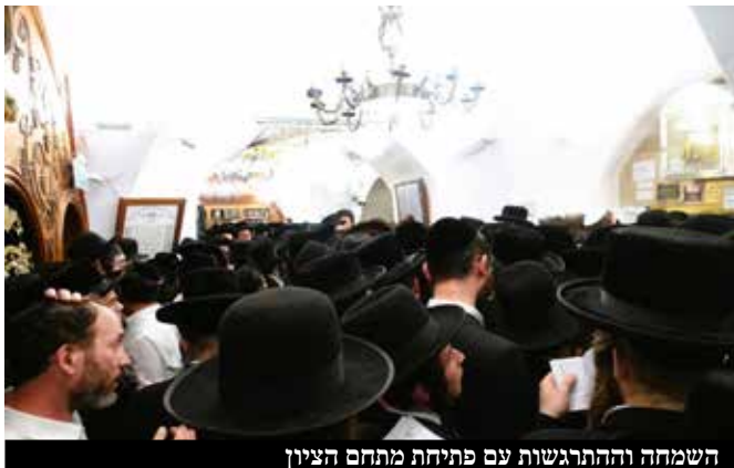
השמוחה וההתרגשות עם פתיחת מתחם הציין