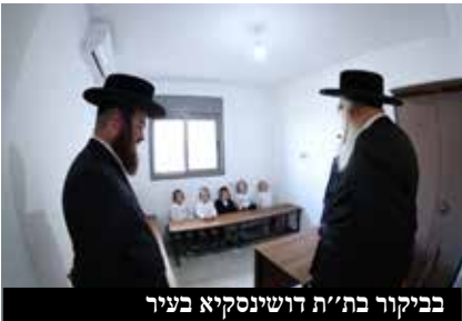
בביקור בת"ת דושינסקיא בעיר