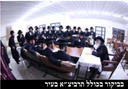
בביקור בכולל תרביצ"א בעיר