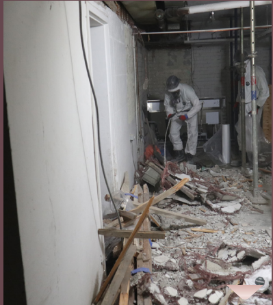
ניין, זיי גייען נישט מיט קיין ווייסע קיטלעך... ס'איז ספעציעלע שוץ-קליידער בשעת'ן ארבעטן מיט די שערליכע שטויב