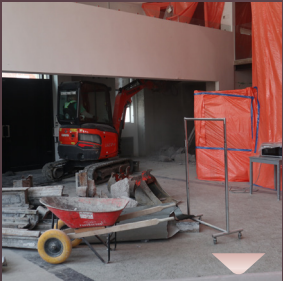
דער טראקטאר לעכערט דעם דאך פונעם סעיף, ארויף צום אויבערשטן שטאק