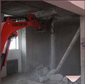
ס'קומט השפעות פון אויבן... ער לעכערט און ס'גייט זיך חומר ולבנים