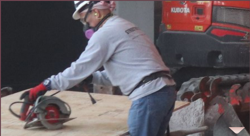
מ'ארבעט אריין אן אפשטעל ב"ה