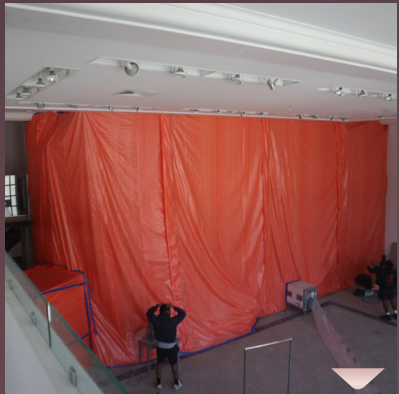
מ'האט אפגעטיילט חלקים אין בנין אלס ספעציעלע 'זאונס' וועלכע האבן די שערליכע 'אובעסטוס' שטויב, וואס מ'ענדגט אצינד אויסרייניגן (בלים פון אויבן אין עזרת נשים)