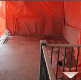
אריינגעשינטן אין די צעמענט העכער'ן סעיף אויפ'ן אייבערשטן שטאק, כדי צו קענען עפענען דעם לאך פאר די טרעפ