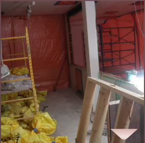
גאנצעס פעקלעך מיט אפגעטיילטע שטיקער ווענט, פול מיט אובעסטוס