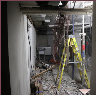
מ'שילט נישט קיין קארטאפל נאר ווענט, מ'דייסט אויס שטיקער טיילס, שיטראק, און אנדערע מאטריאל וואס זענען פול מיט אובעסטוס